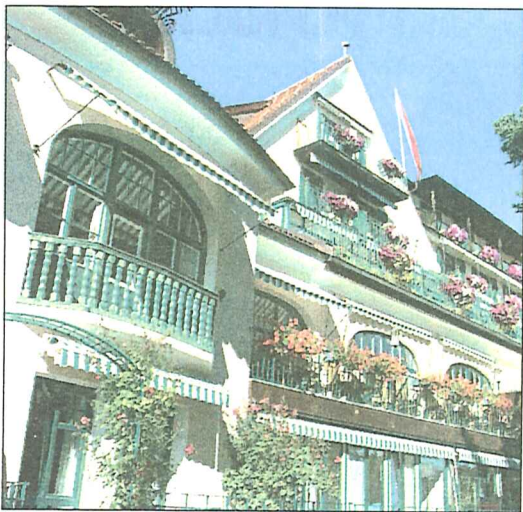
Ein harmonisches Spiel von Formen und Farben, von Alt und Neu: Die elegante Frühstücksveranda an der Südseite des Jugendstil-Hotels ist heute zum Speisesaal umfunktioniert (Bild oben links). Mit viel Feingefühl für den historischen Bau fügte Architekt Uli Weger im Vorjahr den teilweise unterirdisch angelegten Wellnessbereich in das „Parkhotel“ ein (Bild rechts).

Für die Auszeichnung des Jahres 2008 reichten 20 Hotels und Gasthöfe ihre Bewerbung ein. In die engere Auswahl schafften es die Dependence „Alte Post“ des Dolomitenhofes im Fischleintal in Sexten, die Brixner Traditionshäuser Hotel „Elephant“ und „Goldener Adler“, das Hotel „Westend“ in Meran und der „Schwarze Adler“ in Sterzing (Fotos unten v.l.n.r.).