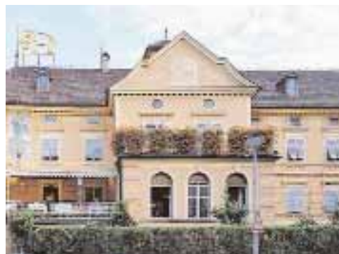
Hotel Elephant Weißlahnstraße 4 / Via Rio Bianco 4 I-39042 Brixen/Bressanone www.hotelelephant.com