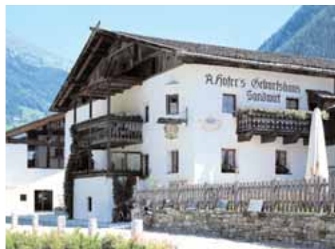
Gasthof Sandwirt Passeiererstraße 72 / Via Passiria 72 I-39015 St. Leonhard in Passeier/San Leonardo in Passiria www.sandwirt.it