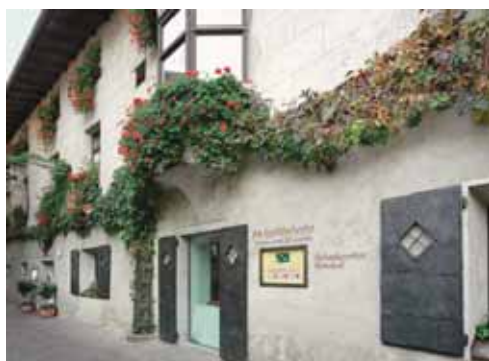
Finsterwirt Oste Scuro Domgasse 3 / Vicolo del Duomo 3 I-39042 Brixen/Bressanone www.finsterwirt.com