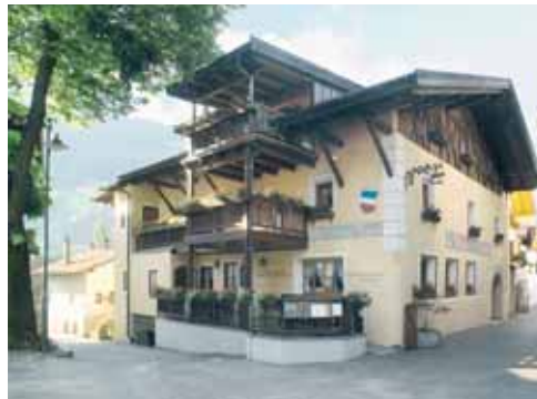
Gasthaus Lamm Dorfstraße 36 / Via Villaggio 36 I-39010 St. Martin in Passeier/San Martino in Passiria www.gasthaus-lamm.it