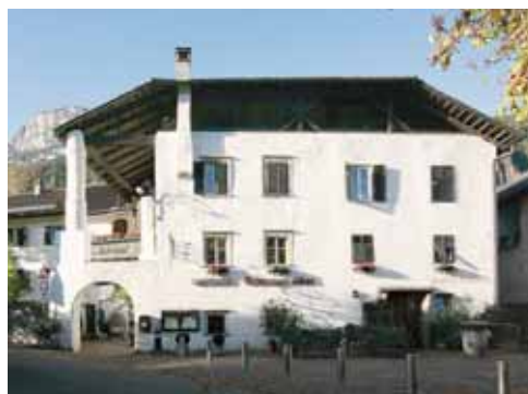
Gasthof Schwarzer Adler Albergo Aquila Nera St.-Urban-Platz 2 / Piazza S. Urbano 2 I-39010 Andrian/Andriano