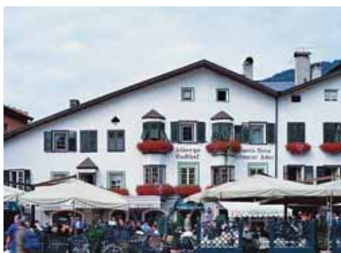
Hotel Schwarzer Adler Albergo Aquila Nera Stadtplatz 1 / Piazza Città 1 I-39045 Sterzing/Vipiteno www.schwarzeradler.it