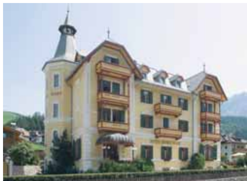
Hotel Monte Sella Catarina Lanz Straße 7 / Via Catarina Lanz 7 I-39040 St. Vigil in Enneberg/San Vigilio di Marebbe www.monte-sella.com