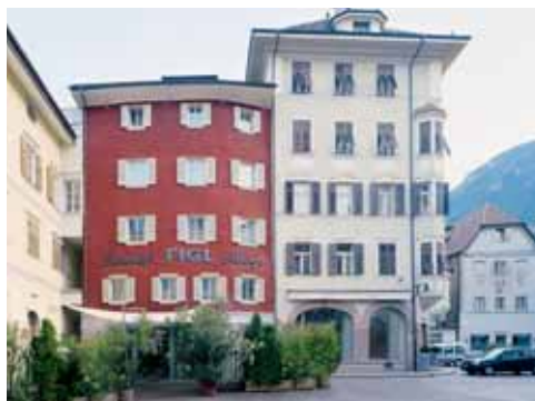
Hotel Figl Albergo Figl Kornplatz 9 / Piazza del Grano 9 I-39100 Bozen/Bolzano www.figl.net