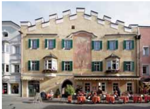
Hotel Restaurant Lilie Neustadt 49 / Città Nuova 49 I-39045 Sterzing/Vipiteno www.hotellilie.it