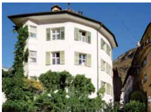
Batzenhäusl Ca' de Bezzi Andreas-Hofer-Straße 30 / Via A. Hofer 30 I-39100 Bozen/Bolzano www.batzen.it