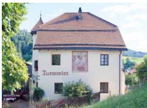
Gasthof Turmwirt Gufidaun 50 / Gudon 50 I-39043 Klausen/Chiusa www.turmwirt-gufidaun.com