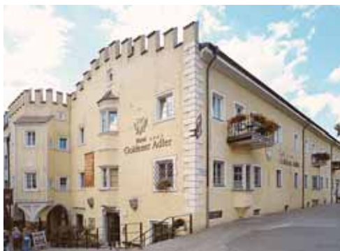
Hotel Goldener Adler Adlerbrückengasse 9 / Via Ponte Aquila 9 I-30042 Brixen/Bressanone www.goldener-adler.com