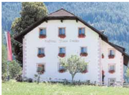
Gasthof Saaler Wirt Saalen 4 / Sares 4 I-39030 St. Lorenzen/San Lorenzo di Sebato 4 www.saalerwirt.it