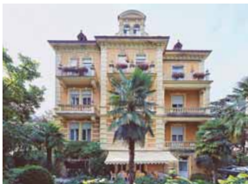
Hotel Westend Speckbacherstraße 9 / Via Speckbacher 9 I-39012 Meran/Merano www.westend.it