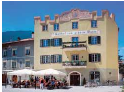
Gasthof zum grünen Baum Albergo Albergo Verde Stadtplatz 7 / Piazza Città 7 I-39020 Glurns/Glorenza www.gasthofgruenerbaum.it